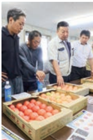
▲トマトの目合わせをする部会員ら

目合わせ会では、A品を開封し、色合いや形などの規格を確認。市場動向や出荷計画を確かめ、D品を使った加工品の製造なども協