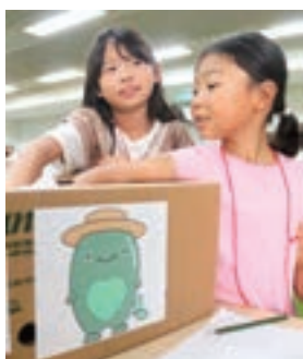
▲手探りで野菜や果物を当てる参加者

JA庄原地域は8月21日、JA庄原支店で「夏休みちやぐりん親子教室」を開きました。小学生や保護者ら25人が参加し、クイズでJA管内の特産品について理解を深