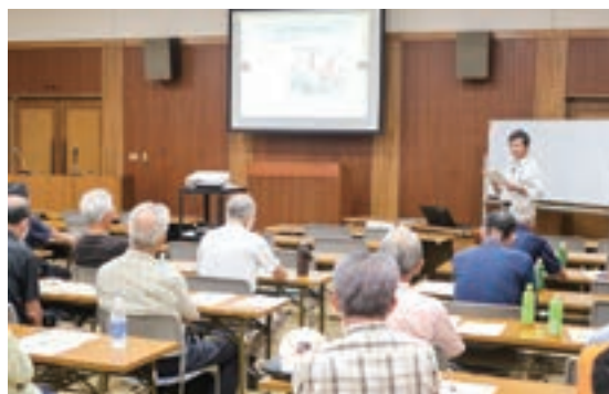
▲刈り払い機作業の注意点を学びました

広島県農業機械士協議会と庄原市地域農業集団連絡協議会は8月21日、県立農業技術大学校で2024年度地域ぐるみ安全対策研修を開きました。県内の農事組合法人や営農集団の関係者、農業機械士ら約30人が参加。刈払機作業の注意点や危険予知訓練(KYT)を学び、農作業事故防止の意識を高めました。